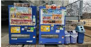
屋外に設置している自動販売機