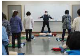
普通救命救急講習会