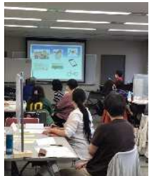
外国人支援ボランティア活動