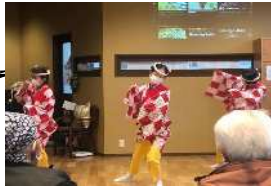
舞踊ボランティア活動