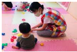
夏の体験ボランティア