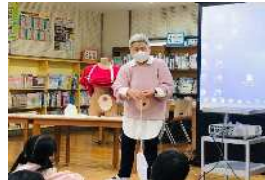
小学生の福祉教育