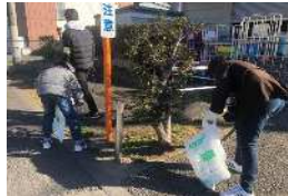
ゴミ拾い ボランティア活動