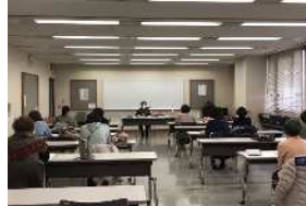
音訳ボランティア養成講座