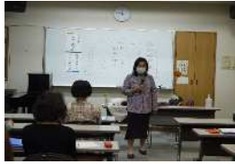
協力会員養成講習会

子育てを手伝える方と子育ての手助けが必要な方を会員とする相互援助事業を実施し、地域で支え合う「子育て支援ネットワーク」の充実に努めます。