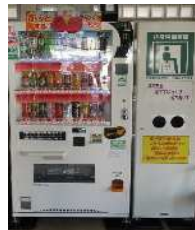
屋内に設置している自動販売機